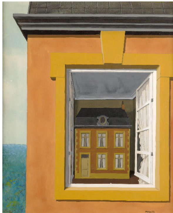
Une maison dans le Lot-et-Garonne (photo 2017) et René Magritte, Eloge de la dialectique (1937) 38 x 32 cm, Musée d'Ixelles Bruxelles