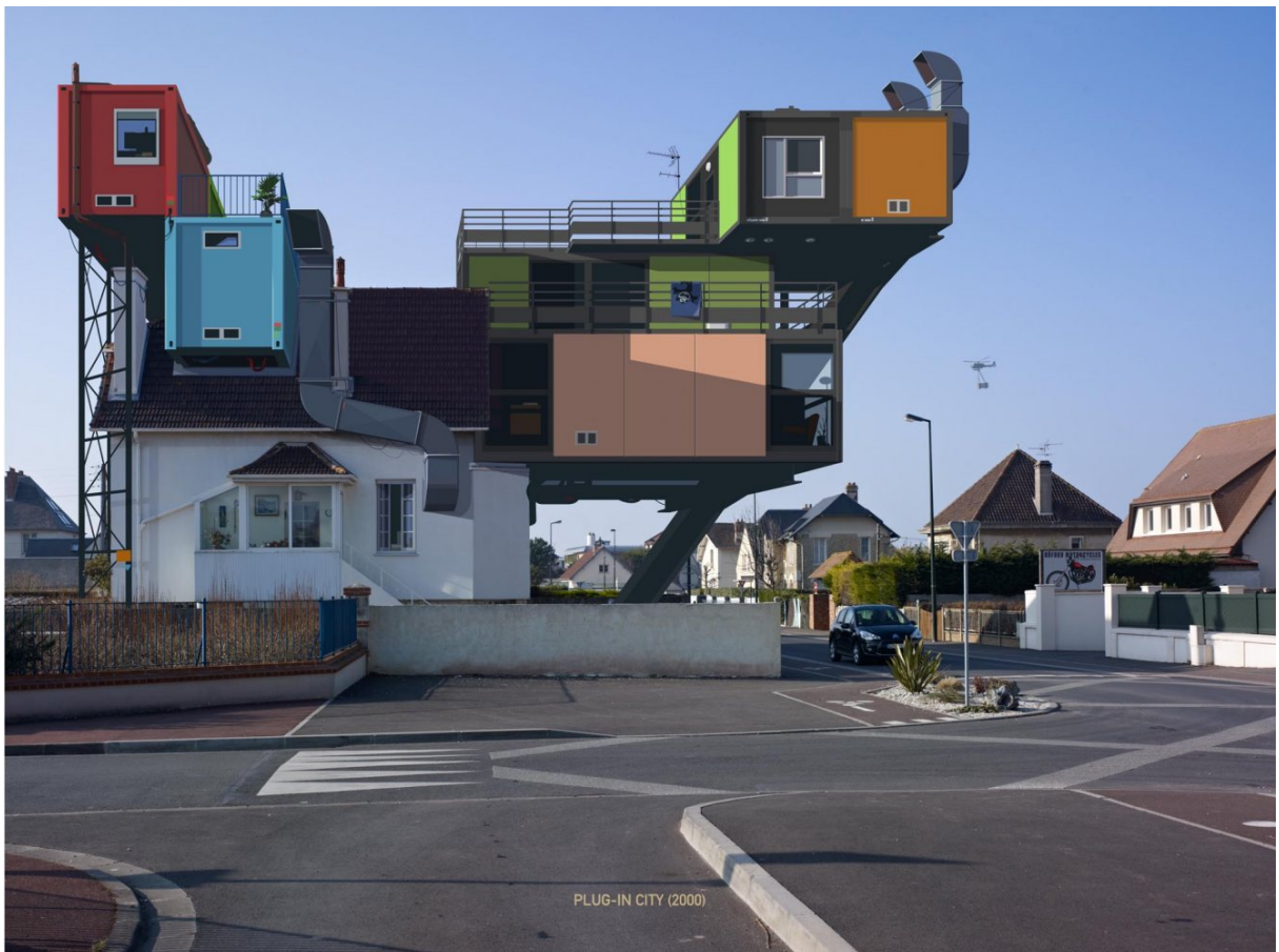
Alain Bublex*, Plug-in City 2000, Un weekend à la Mer 2, 2012

*Artiste français né à Lyon en 1961, Alain Bublex développe depuis les années 90 un travail artistique hybride au carrefour de l'urbanisme, de la photographie et de l'installation. Tour à tour urbaniste, chercheur et voyageur, il propose un travail qui emprunte à la fois au carnet de voyage et à l'utopie, et réinvente ainsi l'idée du paysage, la voiture étant pour ce faire une plateforme idéale, au même titre que l'appareil photo.