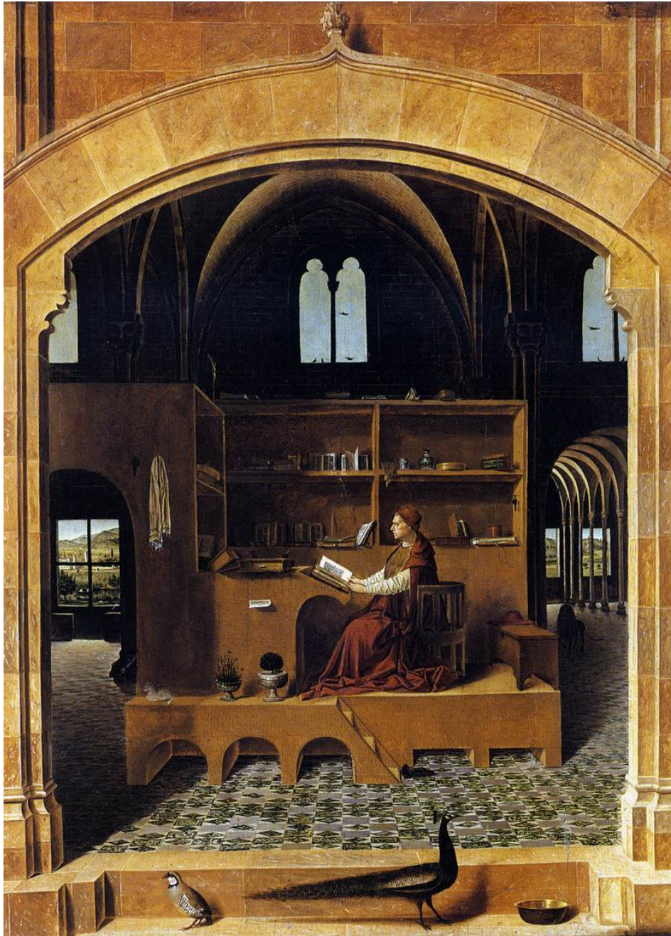
Antonello de Messine, Saint-Jérôme dans son étude, huile sur bois, vers 1475, Nationale Gallery de Londres.

Ces deux documents (image et texte) pourront servir de base à l'entretien de la semaine prochaine. Vous devrez donc vous interroger sur la signification de cette représentation et vous demandez en quoi elle peut intéresser le domaine de l'architecture intérieure.