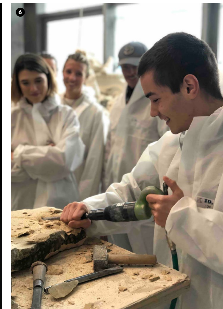
6 Atelier Campus