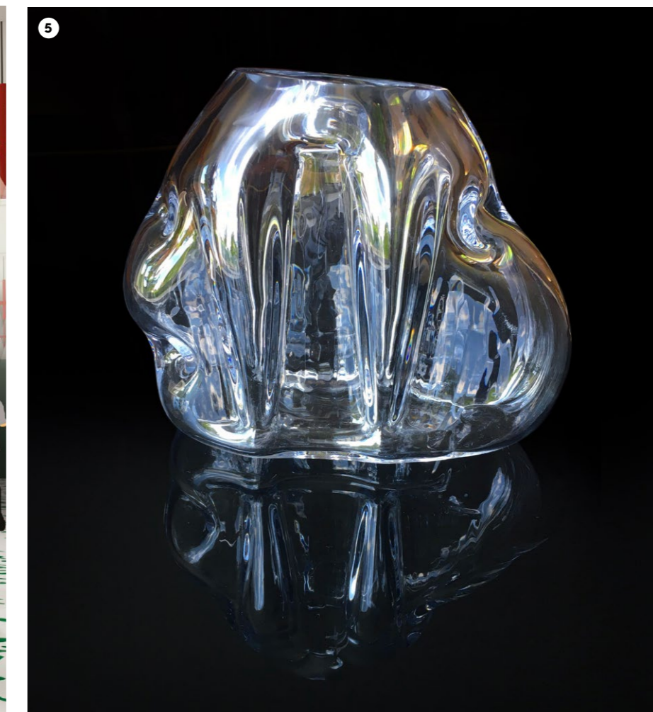
5 Formes libres Anaïs Junger