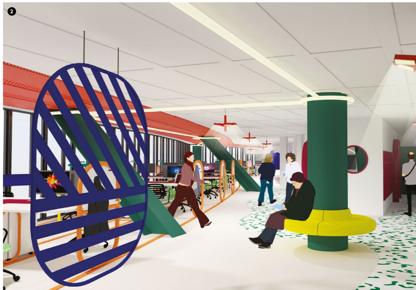
2 Espaces pour demain B. Bonnot