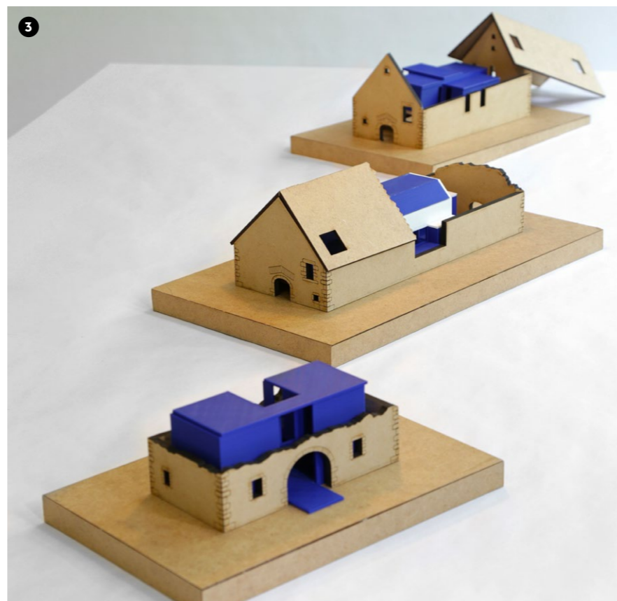
3 Habitat oublié Charline Benazech