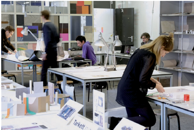
→ Workshop 4 e année Tarkett