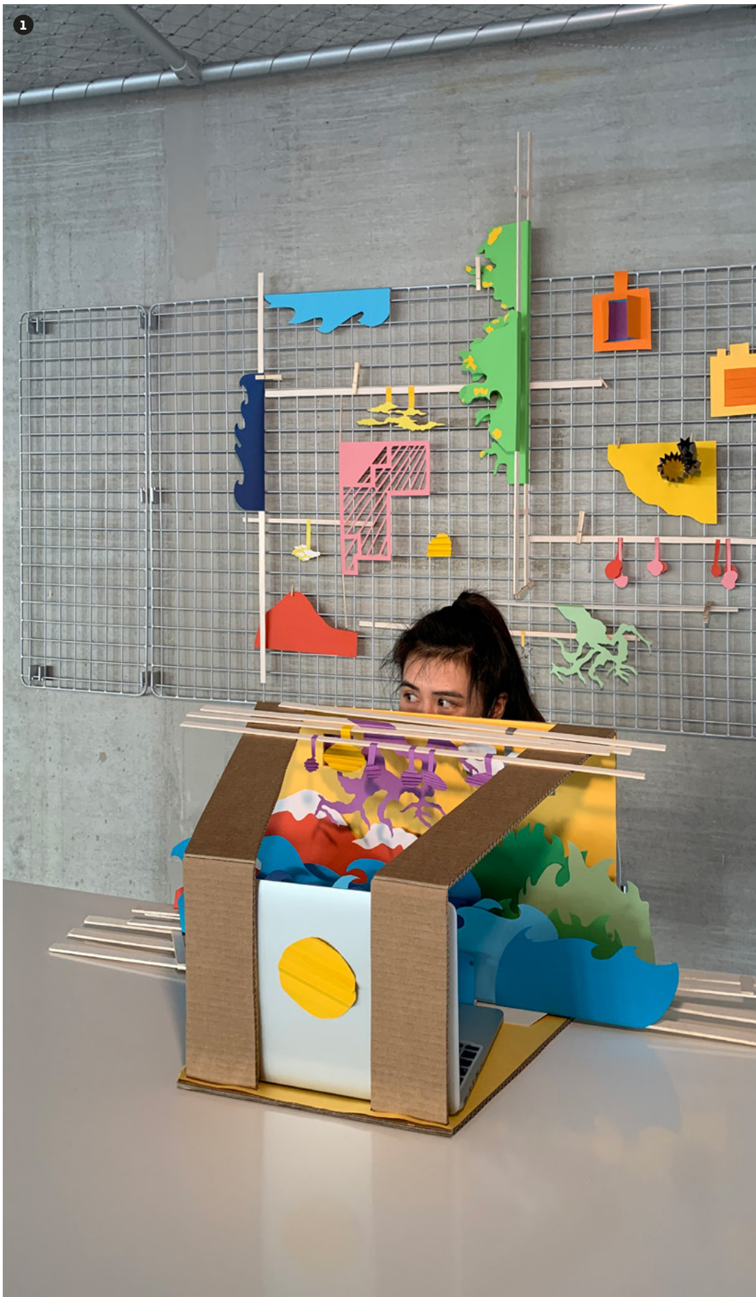
1 Workshop, École Camondo et la HEAD - Genève Réalisé à distance, octobre 2020