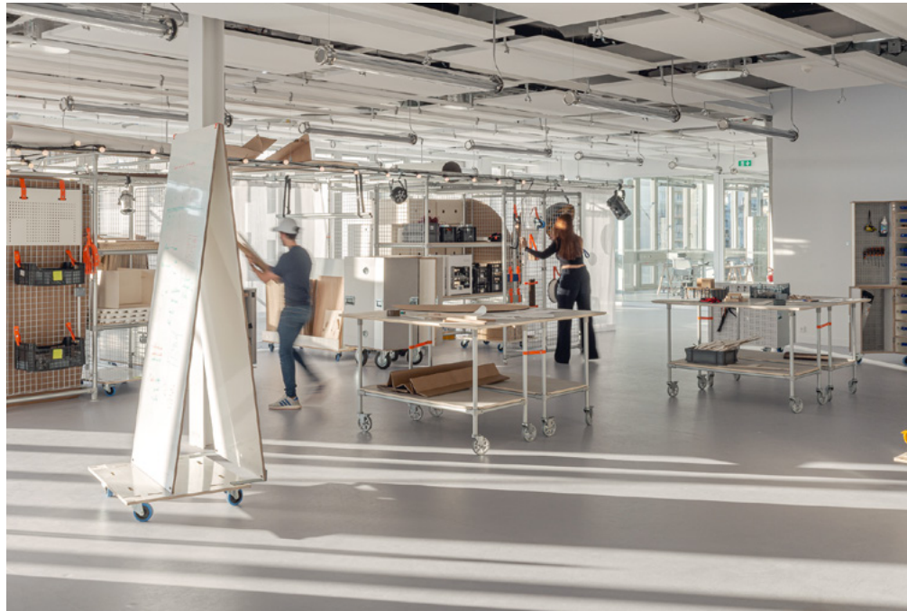
École Camondo Méditerranée, design Paul Emilieu Studio

Retrouvez toutes les dates-clefs sur notre site internet Find our key dates on our website