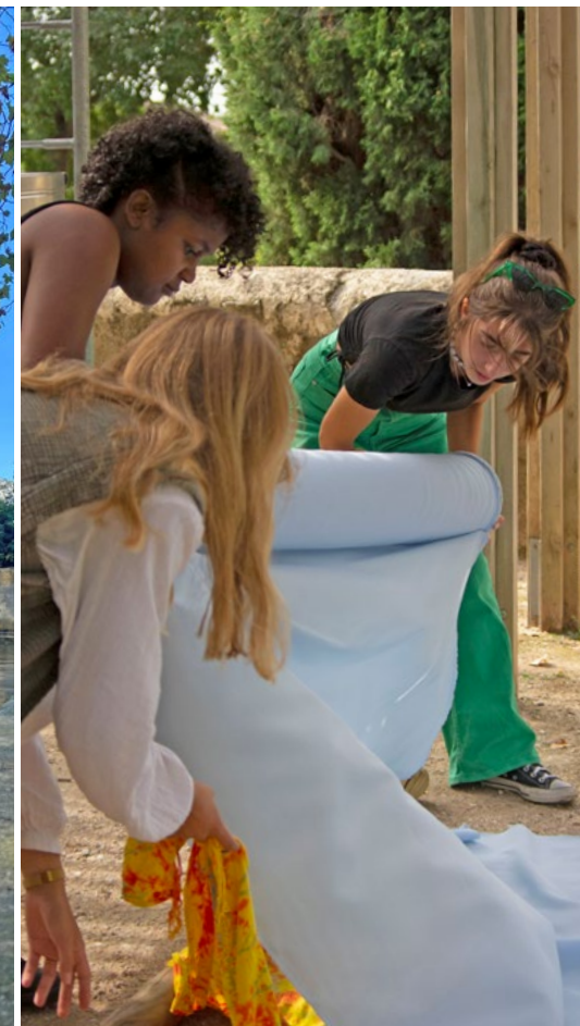
6 Workshop «Couleurs du jour» Design Parade architecture intérieure, Toulon.