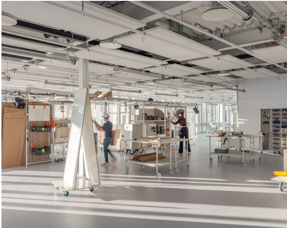
École Camondo Méditerranée, design Paul Emilieu Studio

L'école Camondo est une entité de l'institution culturelle Les Arts Décoratifs The Camondo School is an entity of the cultural institution Les Arts Décoratifs