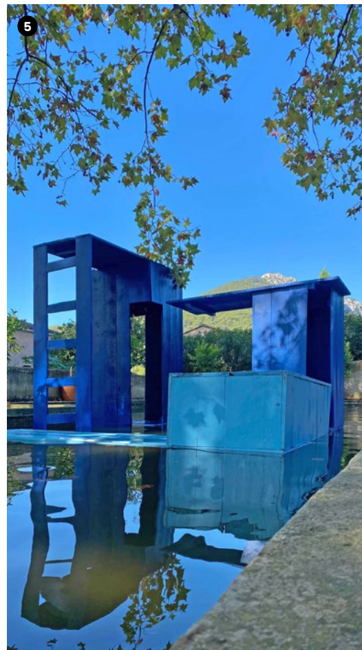
5 Workshop «Espace et paysage» Domaine remarquable de Baudouvin.