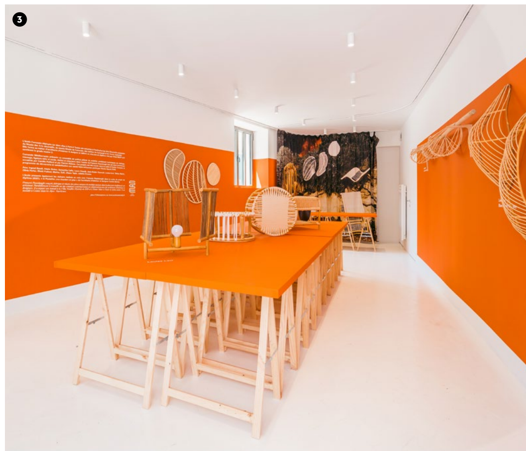
3 Atelier Campus 4 e année, Design Parade, Hyères. Workshop rotin dans le cadre du programme de sensibilisation aux savoir-faire